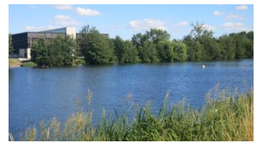
Un parcours remarquable en pleine nature